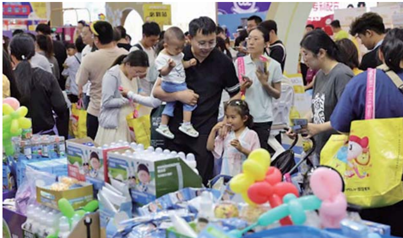
热闹的第二届黄河流域孕婴童产业博览会现场。(资料片)

设计,设有爬爬赛、学步赛、障碍赛三大趣味赛道,完赛宝宝可获定制成长勋章;“动力乐园”体能挑战赛邀请亲子组队闯关,在游戏中增进亲子感情、培养协作能力;孕妈专属的“孕美律动课堂”由三好妈咪资深导师带领体验孕期舞蹈,在律动中感受生命的美好。