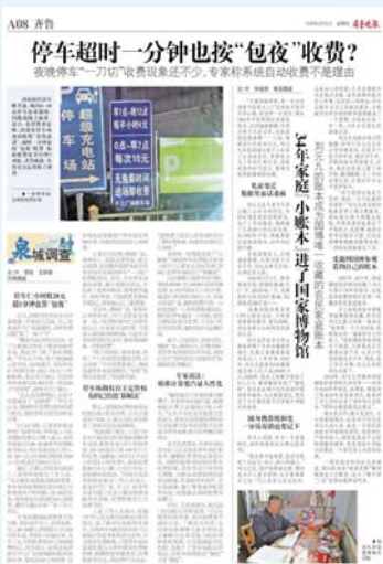
本报5月15日A08版刊发的报道。

5月22日,济南市人民政府官方网站发布《济南市发展和改革委员会 济南市城市管理局 济南市市场监督管理局关于规范我市市场调节价公共停车场夜间停车收费计费规则的通知》(以下简称《通知》)。《通知》要求全市市场调节价停车场设置夜间封顶收费,“不得采用‘只按次、不计时’等不合理的‘一刀切’计费方式”。