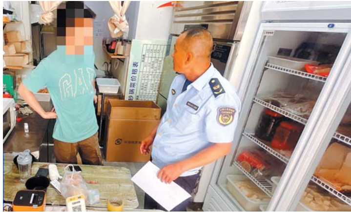
相关部门到涉事炸豆腐店现场处置。

想开办小餐饮企业,需要办理营业执照和食品经营许可证等手续。那么,在小餐饮企业办理营业执照等手续的时候,审批部门是否会将其经营场所有无独立烟道纳入审查范围呢?