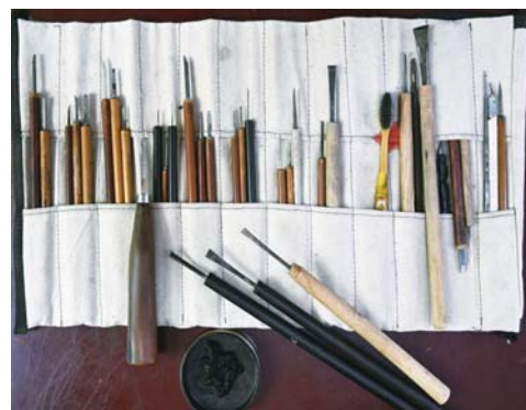
李公山用的每一把刻刀都是自己制作的。