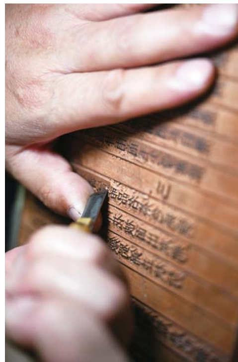
李公山的刻版字口犀利垂直。