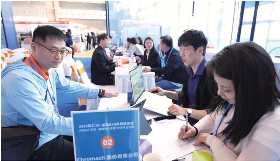
在2025年仁川-威海B2B采购洽谈会上，采购商和企业正在洽谈商贸对接事宜。

十年来，双城双馆双向奔赴的“别样”牵手，让中韩地方城市的更多人、更多事都牵起手来，也让中韩地方城市交流合作有了新标杆，为深化两国经贸往来与人文交流提供了鲜活的样本。