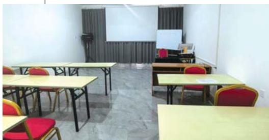
某养老机构升级了硬件设施， 山东投融资担保集团支持下。

中小民营养老机构因规模小、盈利能力弱、缺乏有效抵押物，普遍存在融资难题。山东投融资担保集团深谙其困，创新推出“鲁担养老服务贷”，力破中小型民营养老机构融资难题。据了解，该产品通过“政府引导、担保增信、银行授信”三方协同模式，实现了金融资源与养老服务需求的精准对接。并创新构建了银行、国担基金、省级再担保和市、县级政府性融资担保机构四级风险共担机制，各按20%比例共担分险，增强了整个融资担保体系的稳定性。