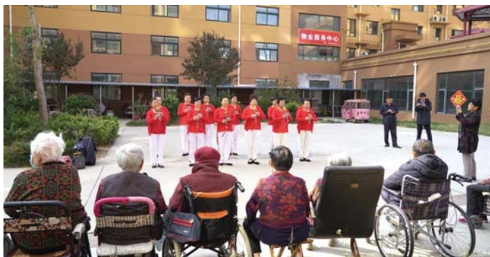
聊城市莘县某养老机构老人们的休闲娱乐时光。

低成本的贷款资金直击养老机构发展痛点，越来越多的机构得以升级设施设备，引进专业人才，提升服务质量，为构建山东多层次、高水平养老服务体系奠定了坚实的基础。这不仅关乎产业振兴，更承载着老人们安享幸福晚年的时代使命。相信随着“鲁担养老服务贷”的持续推广，一幅“老有所养、产业兴旺、社会和谐”的银发经济图景，必将在更广阔的土地上生动铺展。