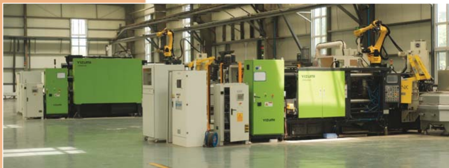
某科技公司更新了硬件设备， 山东投融资担保集团支持下。

金融与科技的结合,绝非简单的资金供给,而是塑造创新生态的关键力量。山东投融资担保集团以“鲁担科技贷”为支点,通过创新金融渠道打通科创企业融资堵点,精准浇灌每一颗创新的种子,科技自立自强的土壤必将日益丰饶,驱动新质生产力蓬勃生长。