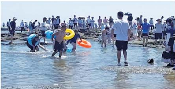
救援现场。视频截图