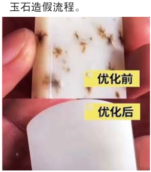
玉石造假前后对比。

称为“拔猴毛”。 阿富汗玉外观与和田玉相似，价格悬殊，却被混入和田玉在直播间销售。商家称，十几元的阿富汗玉佩鉴定证书，直播间价格可翻几十倍。 记者联系到的办证人士表示，提供阿富汗玉即可迅速制作匹配的和田玉“鉴定证书”，每张2元，且保证可扫码验真。记者告知位置后，一名骑电动车的男子拿到玉石后匆匆离开。不到半小时，假的和田玉“鉴定证书”就做好了。 这些和田玉“鉴定证书”的出具机构为“国石珠宝首饰检验检测中心”，证书上颜色、质量、折射率、密度等信息样样俱全，扫描二维码也能显示鉴定内容。但记者在国家企业信用信息公示系统中，未查询到该机构的任何信息。业内人士告诉记者，这家鉴定机构纯属虚构，其目的就是欺骗消费者。