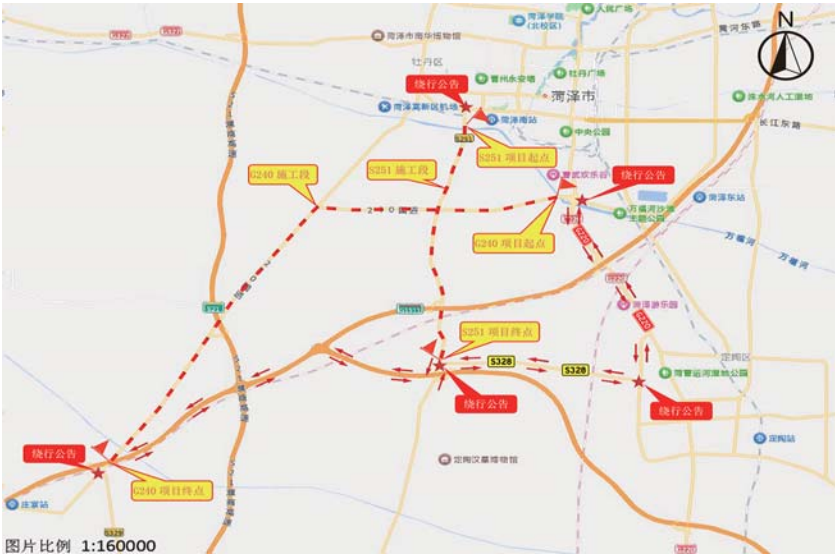
二、绕行路线示意图