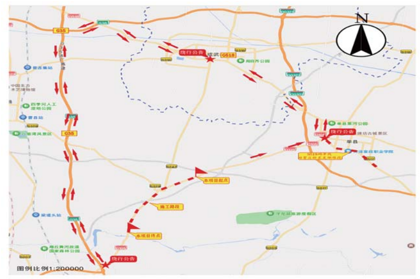
二、绕行路线示意图