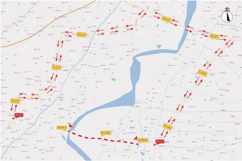
二、绕行路线示意图