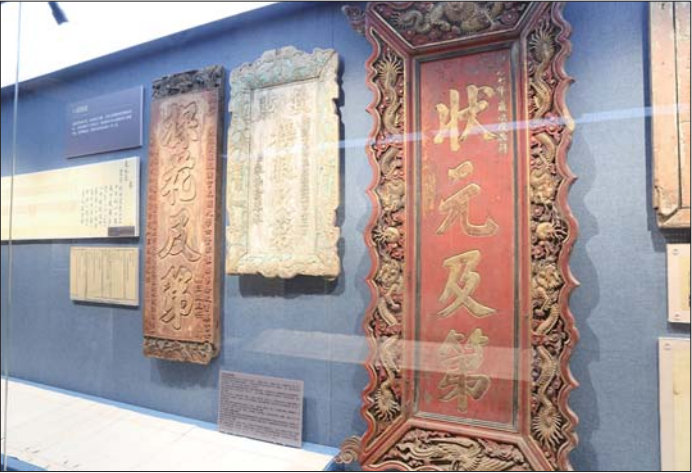
状元及第、榜眼及第、探花及第牌匾。

殿试是古代科举考试最后一关，由皇帝主持，答卷时间限一天，日出出卷，日落交卷。试卷中，赵文楷书法笔画流畅，字体工整，始终保持清晰的字形和节奏感，且论点清晰精彩，呈现书法与思想的完美结合，足见状元的含金量。历史记载，赵文楷于嘉庆元年高中状元后，授翰林院修撰、实录馆纂修、文渊阁校理、教习庶吉士。 “这份试卷是我们的镇馆之宝，在推行科举考试的1300年里，这是现存的唯一一份清朝状元试卷。”希晓古今教育博物馆馆长刘晓表示，试卷的宝贵不只来自其唯一性，也是研究古代教育情况的载体，便于了解清朝的治国理政思想，“同