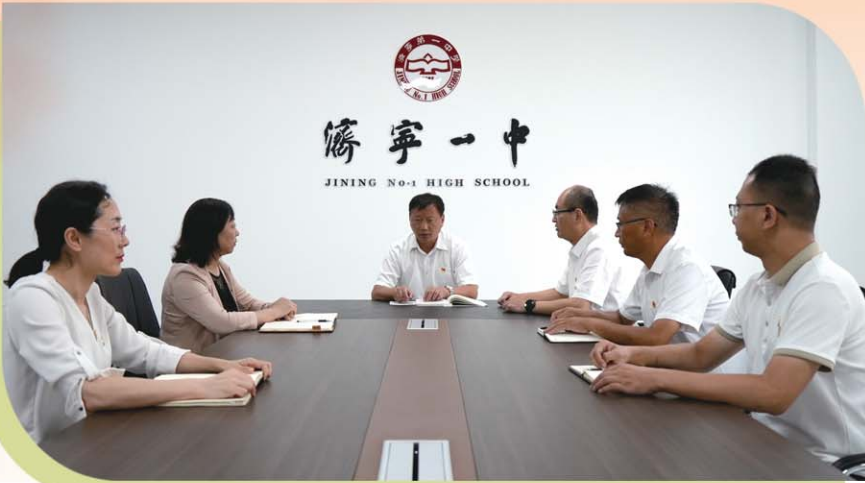
团结奋进的学校领导班子。

四年如斯，犹在眼前。回想那些珍贵的时光，总有一种精神鼓舞我们前行，总有一群身影催人奋进。