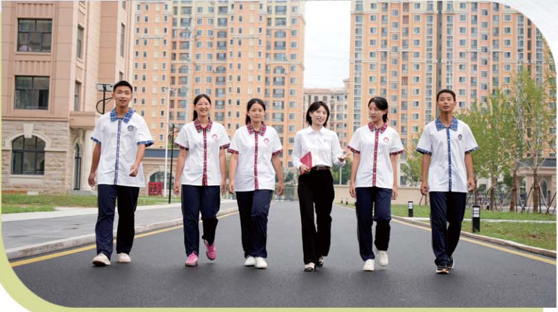
风华正茂的济宁一中任城校区师生。