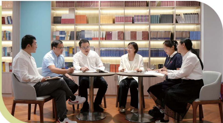
教师们在进行集中教研。

学校高度重视教学常规管理，实行随机查课、每日考勤，开展随机推门听课，提高教师对常规课堂的积极性，确保课堂有效性。实行“学校—年级—教师—学生”多层级联合管理的办法，学校对年级加强教学常规监管，年级部对教师课堂管理结果进行考核公示，班主任对班级任课教师和学生双重管理，学生对日常课堂进行“一课一考”评价，不断提升课堂教学质量，提高教学的有效性。