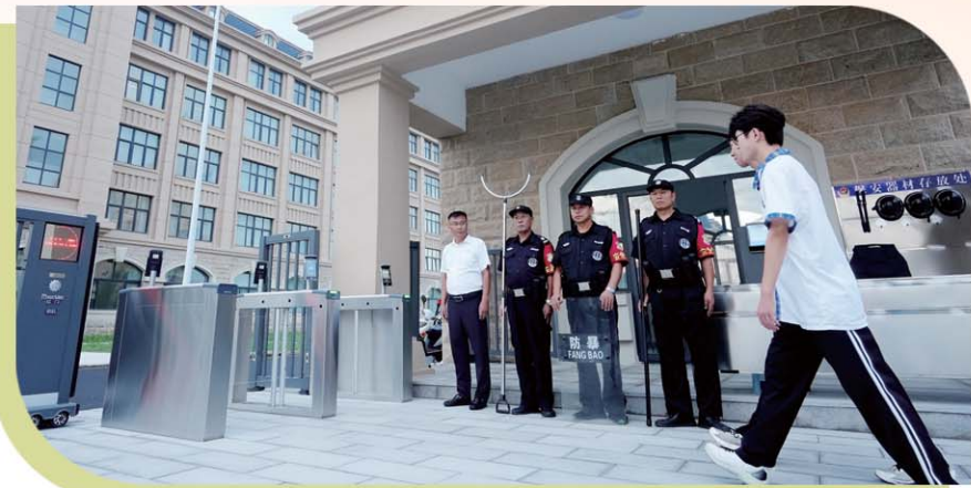
多措并举，打造平安校园。

同时，学校运用信息化安全管理方式，如视频监控、人脸识别、电子班牌请假等提高安全管理的效率和准确性。通过“数据共享”的信息化管理平台，实现校园安防系统的统一管理和整合联动，提升校园的综合防范能力；通过家长、教师、学校安保人员、宿舍餐厅管理人员等共同参与，层层分级、多级联动，全方位、立体式保护学校师生安全，提升学校整体安全管理水平。