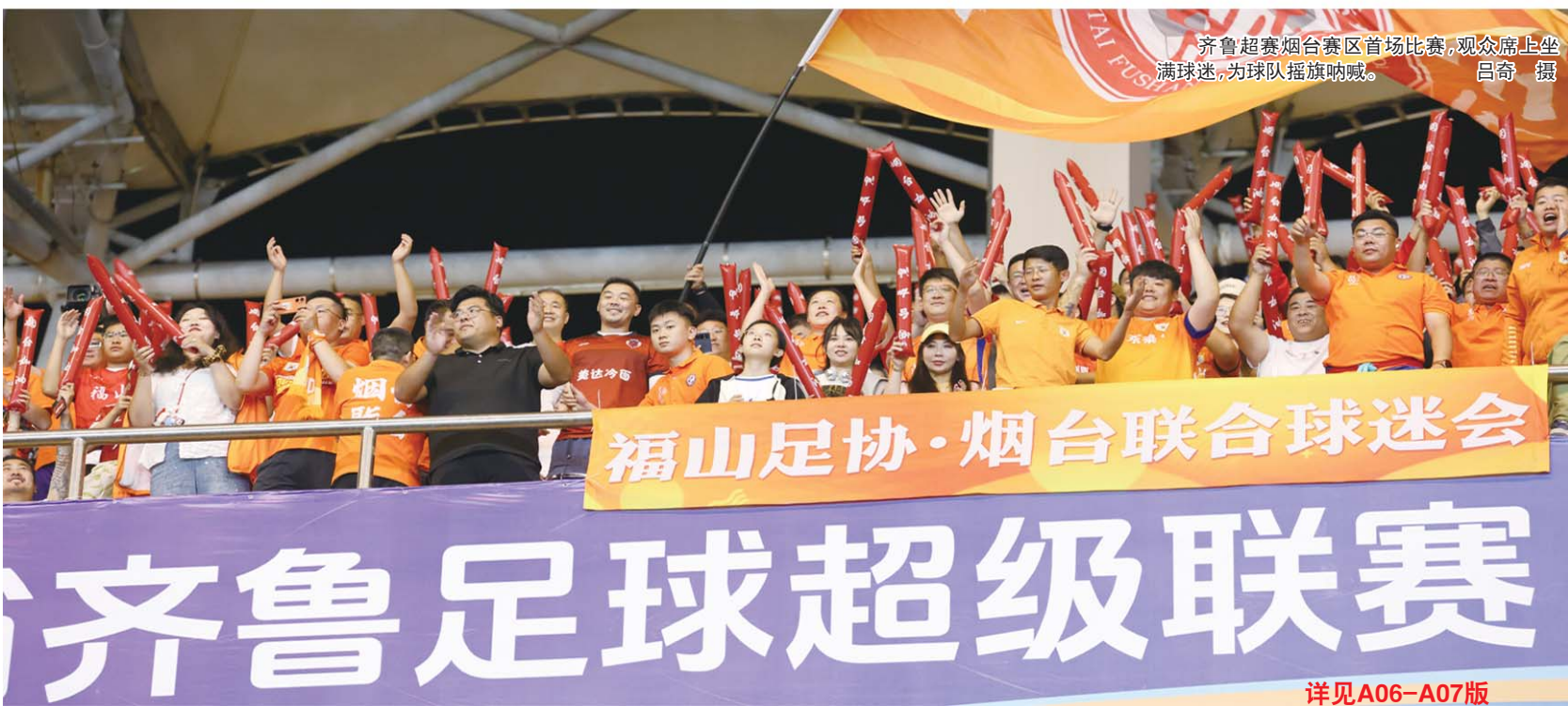
齐鲁超赛烟台赛区首场比赛,观众席上坐满球迷,为球队摇旗呐喊。