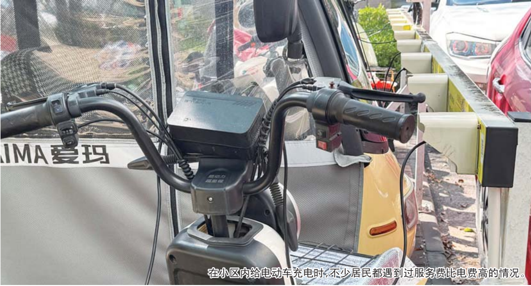
在小区内给电动车充电时,不少居民都遇到过服务费比电费高的情况。

字楼下的电动自行车充电桩发现,其收费项目均包括充电费、服务费两项。其中,各品牌电费均执行0.555元/度的居民生活用电收费标准,但服务费标准不一且分级复杂。