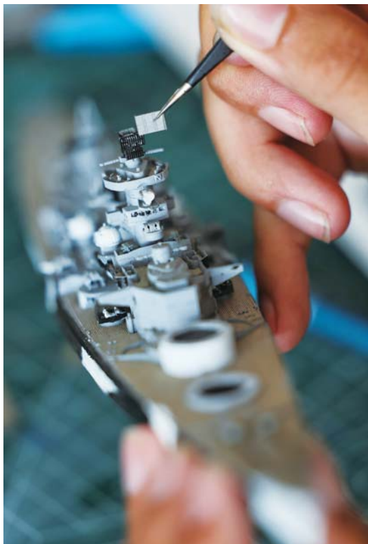
金属改件的尺寸非常小,通常需要用镊子小心翼翼安装。