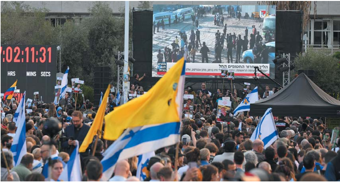
13日，在以色列特拉维夫，人们通过大屏幕观看被扣押人员释放直播。

当地时间13日，巴勒斯坦伊斯兰抵抗运动(哈马斯)已通过红十字国际委员会向以色列方面移交全部20名在世被扣押人员。美国总统特朗普12日称加沙地带的“战争已经结束”，当地局势将“正常化”。以色列总理内塔尼亚胡同一天发表声明说，以色列已做好准备，随时接收所有以方被扣押人员。