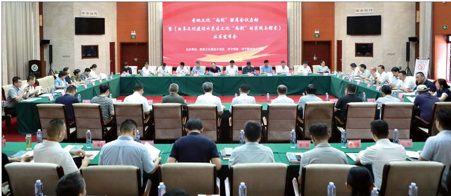
《曲阜文化建设示范区文化“两创”的实践与探索》丛书发布现场。

十年来,在济宁市委、市政府的坚强领导下,曲阜文化建设示范区依托尼山片区宝贵的历史遗存与文化资源,积极参与海内外重大文化交流活动,盘活、链接片区内文化教育资源,通过不断的挖掘与阐释,在打造文化“两创”新标杆和世界文明交流互鉴高地方面发挥了重要作用。