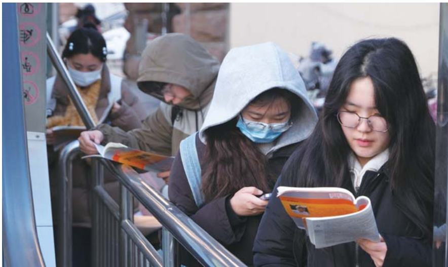
2025考研山东省实验中学考点。资料片