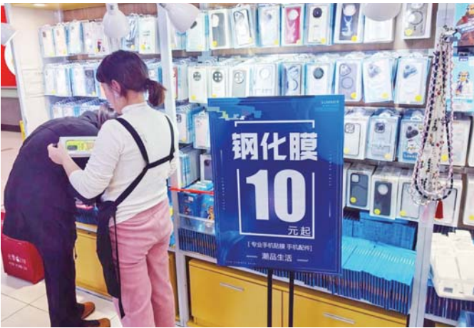
一家品牌贴膜店内，打出“钢化膜10元起”的招牌。