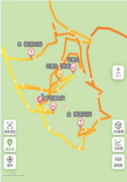
►某户外App上，驴友发布的“五行线路”图。