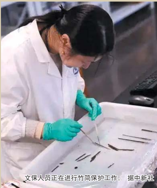
文保人员正在进行竹简保护工作。 据中新社

最近，这部我国最早的诗歌总集又有新的惊喜传来。断更了千年之久的诗经，竟然迎来“全本”续更！近日，江西南昌汉代海昏侯墓考古，首次发现秦汉时期全本《诗经》。海昏侯墓出土的1200枚《诗经》竹简，经红外扫描确认，包含“诗三百五篇”等完整结构，是迄今发现的唯一秦汉时期全本《诗经》。它与我们今天看到的版本有何不同？这一发现将如何改写中国文学史？又填补了哪些史学关键空白？