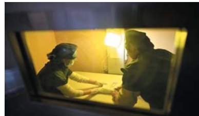
谭艺和同事在为一只鸽子拍X光片。