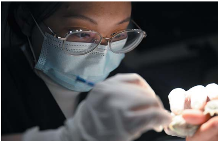
为异宠清创，要特别耐心仔细。