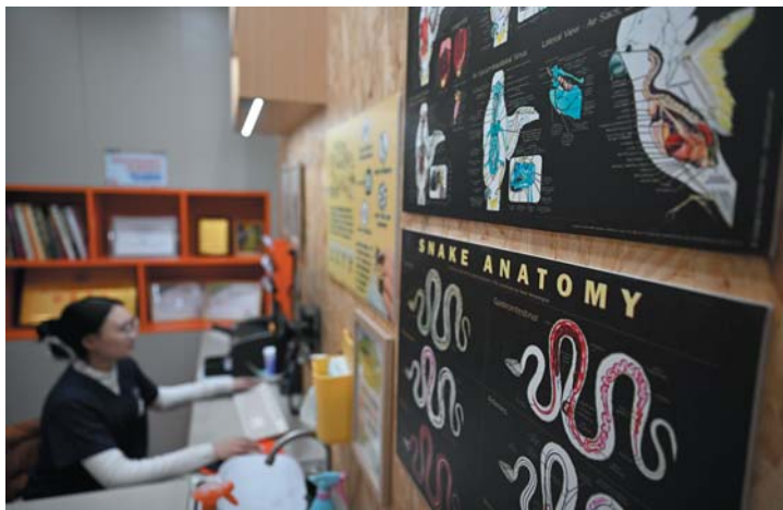
门诊室里贴满了异宠的解剖图。