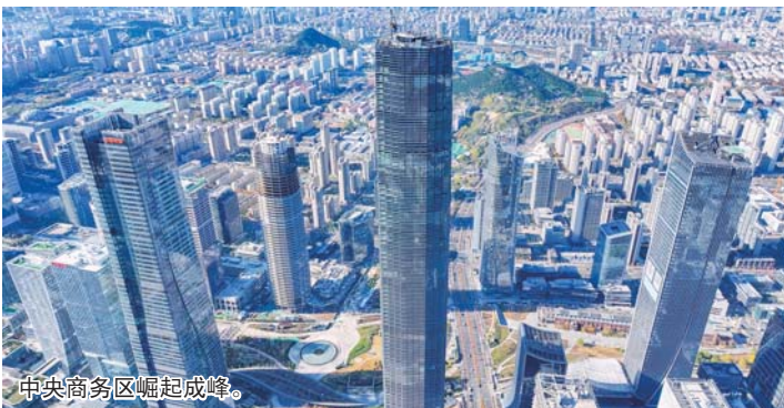
中央商务区崛起成峰。