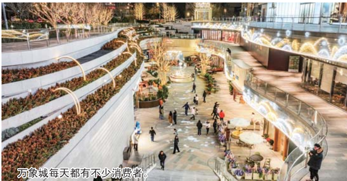
万象城每天都有不少消费者。