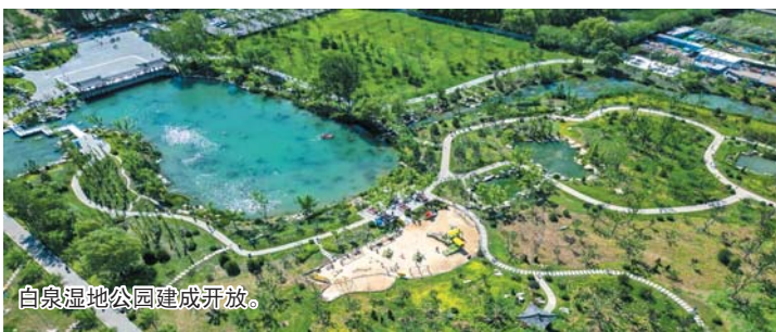
白泉湿地公园建成开放。