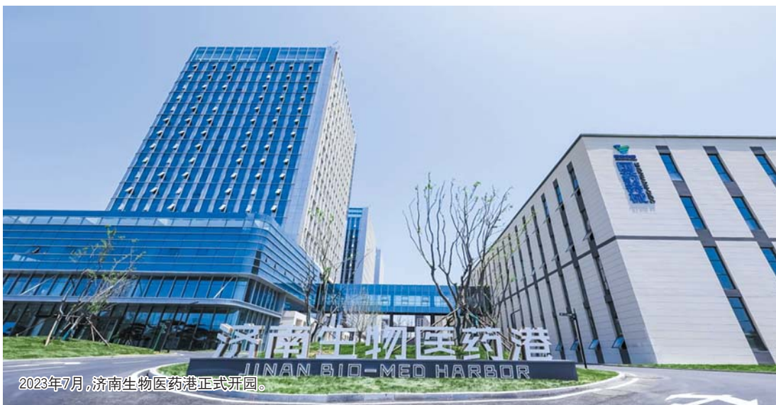
2023年7月，济南生物医药港正式开园。

五年来，历城区坚持“项目为王”，深化“拿地即开工、竣工即投产”改革，固定资产投资连续8年稳居全市第一。2025年1-10月，全区省市重点项目完成投资超450亿元，项目数量、开工率、投资完成率均位列全市前列。历城正以前沿产业的集聚，为济南乃至山东培育新质生产力注入核心动能。