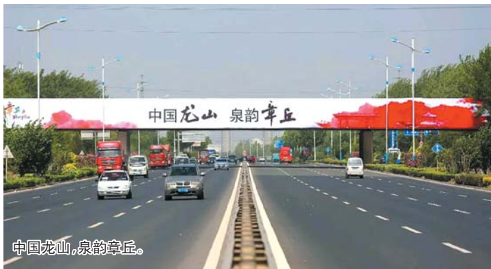
中国龙山，泉韵章丘。

山一程，水一程，逐梦向前行；一条路，一座城，党群一条心。路在无限延伸，城在拔节生长，让我们为了心中梦想笃行不怠，沿着未来之路阔步前进。