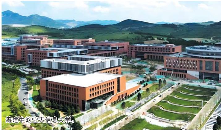
筹建中的天空信息大学。