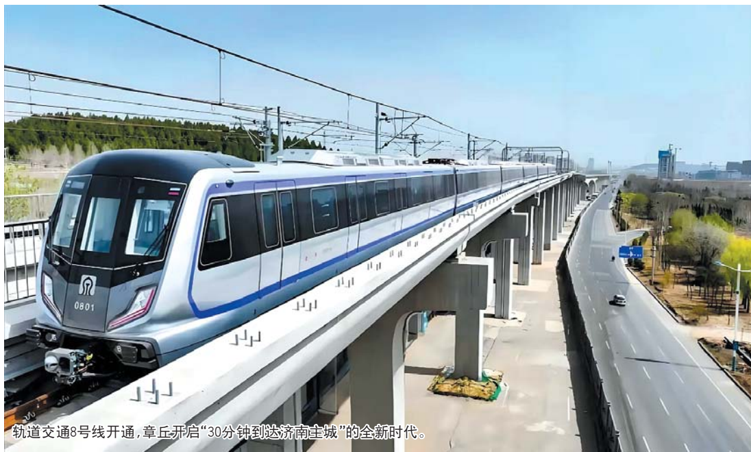
轨道交通8号线开通，章丘开启“30分钟到达济南主城”的全新时代。

高质量发展是时代主旋律。“因地制宜发展新质生产力，加快建设以先进制造业为引领的现代