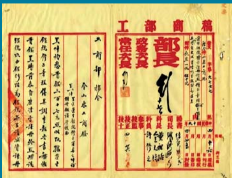
▲工商部关于道生银号的令

至此，道生银号减资注册并颁发新的执照事件画上了句号。在民国时期济南金融史上，道生银号在艰难中苦心经营，在经营中应对各种困扰，留下艰难而值得回味的一笔，其经历成为济南近代金融业在动荡时局中艰难求存的写照。