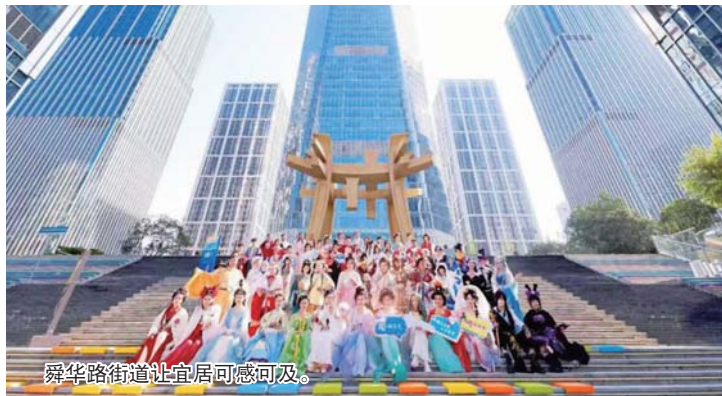
舜华路街道让宜居可感可及。

街道创立“榿秀里”品牌，将市场逻辑与公益初心结合。盘活沉睡资产，将近2万平方米闲置空间，转化为15处像“悦享家”活动中心、“榿秀里”社区文化生活馆这样的活力场域；创新运营模式，社区以空间入股，引入专业“合伙人”进行微利运营，确保服务优质