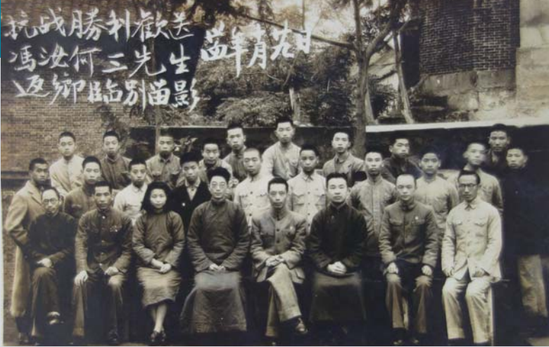
1945年10月，吕荧(一排左四)和夫人潘俊德(一排左三)离开涪陵中学时合影。

吕荧(1915～1969)，当代著名美学家、文艺评论家、文艺理论家、翻译家，为中国当代美学和文艺学建设做出了重要贡献。1950年8月，吕荧应华岗校长邀请到山东大学任中文系教授，后兼主任，主讲文艺学课程。吕荧是山东大学美学研究的拓荒者，美学家周来祥教授便是他的高足，红学家李希凡先生当年也在其门下。在山大期间，身为中文系主任的吕荧还是《文史哲》的热心发起者，倡导者和撰稿者。