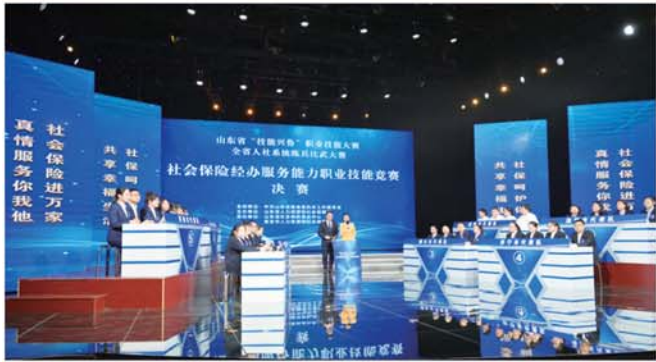
山东省“技能兴鲁”职业技能大赛人社系统练兵比武大赛社会保险经办服务能力职业技能竞赛决赛现场。

社保为民，枝叶关情；前路虽长，行则必达。山东社保将坚定扛牢“走在前、挑大梁”的使命担当，不断提升民生温度，增加幸福厚度，为谱写中国式现代化山东篇章贡献力量！