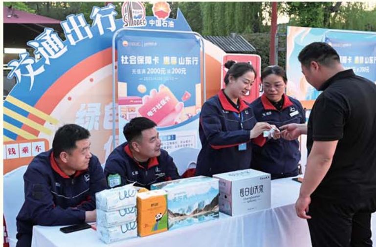
2025年“社会保障卡 惠享山东行”主场活动现场。