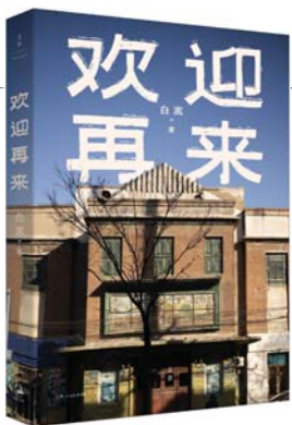
白嵩 著 世纪文景·上海人民出版社 《欢迎再来》