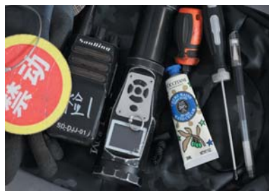
工具包里除了对讲机、手电筒、螺丝刀等常用工具,还有一支护手霜,她说这是女孩子的“刚需”。