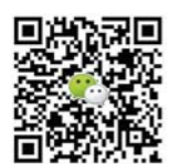
扫码加微信投稿 期待您的精彩佳作