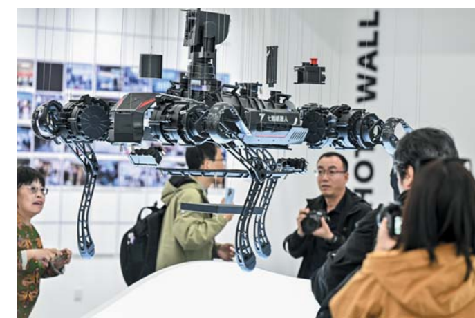
七腾机器人公司的四足机器人。