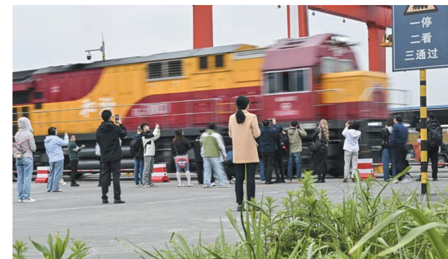
▲一列满载的中欧班列驶出重庆国际物流枢纽园区,这里是中欧班列始发地和西部陆海新通道策源地。