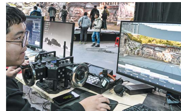
永川科技片场以虚拟拍摄技术为核心,是目前国内空间最大、亮度最高、标准最优的虚拟拍摄棚。