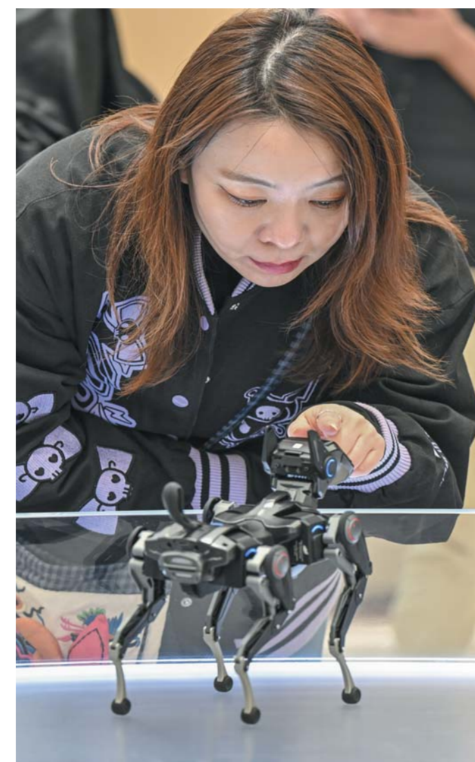
明月湖科创园中,会跳舞的机器狗甚是可爱。