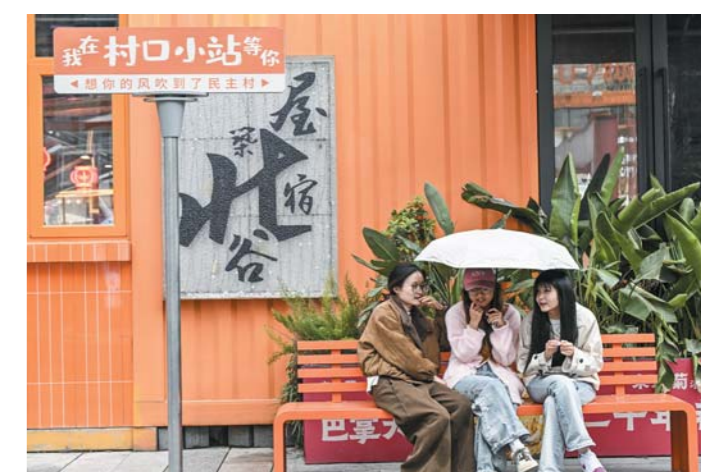
曾是老旧小区,经过改造更新,让人有了新体验。