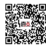
扫码下载齐鲁看点 关注摄影频道