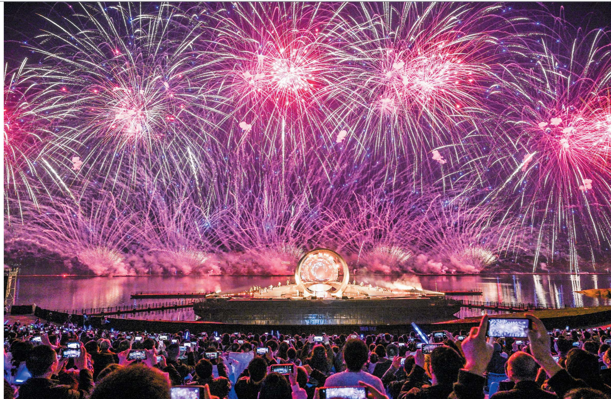
长寿湖空中炫彩烟花在山城春日里续写浪漫。