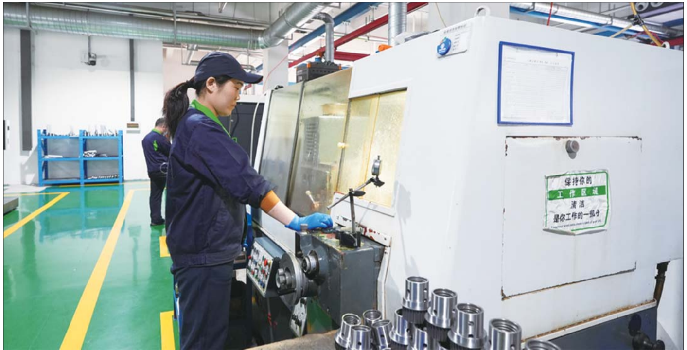
山东理工精密机械有限公司恒温车间生产场景。

目前，全区规上工业企业17家，数字经济遍地开花，成功入选省级服务数字经济发展试点县市区。全区楼宇企业由1300家增加到2500家，年均纳税额超3亿元。