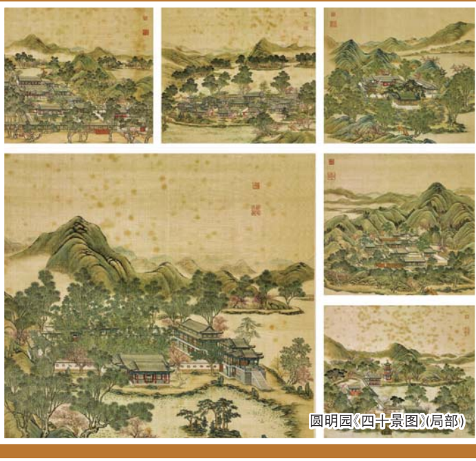
圆明园《四十景图》(局部)

虽然这则法案获得了议会全票通过，但距离国宝回家尚需时日。首先法案要经过法国国民议会与参议院达成一致后方可最终生效。有专家指出，法案生效后对于中国流失文物回归既是具有重要意义“象征性进展”，也能够成为流失文物回归的“实质性突破”，对中国流失海外文物(尤其是法国)的追索与返还带来积极意义。对中国而言，该法案为追索圆明园流失文物、敦煌遗书等大量流失在法国的文物提供了新的法律契机，有望推动国宝从“个案追索”走向“制度化追索”。