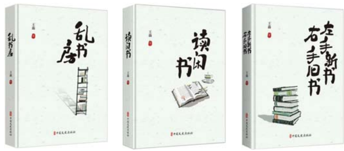
《乱书房》《读闲书》《左手新书右手旧书》 王淼 著 中国文史出版社

（本文摘自《乱书房》《读闲书》《左手新书右手旧书》，内容有删节，标题为编者所加）