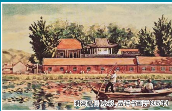
明湖夏景(水彩,岳祥书画于1935年)