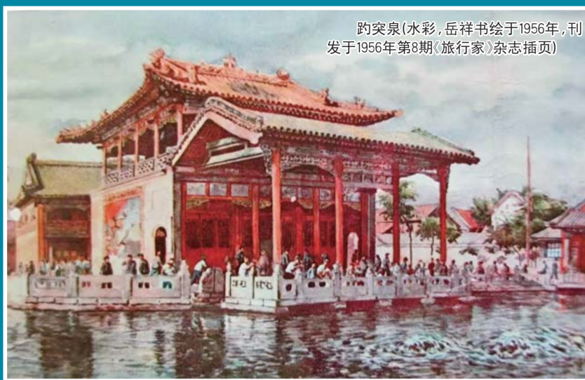
趵突泉(水彩,岳祥书绘于1956年,刊发于1956年第8期《旅行家》杂志插图)