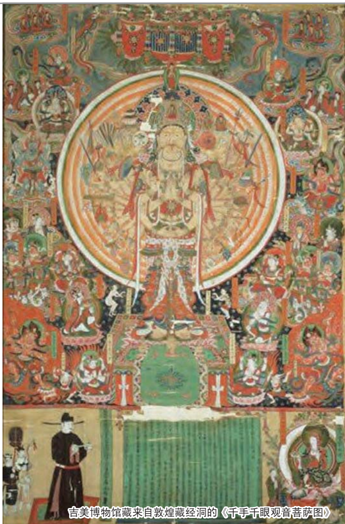
吉美博物馆藏来自敦煌藏经洞的《千手千眼观音菩萨图》

法国汉学家伯希和考古探险队于1906年10月29日首先到达位于新疆喀什和库车之间的图木舒克村，在该地区一直停留到同年12月15日。伯希和在那里发现了库车绿洲西缘唯一的一处佛教大遗址群，发掘到的物品主要有佛教泥塑像、壁画、陶器和杂物、雕刻品、版画等。图木舒克遗址是