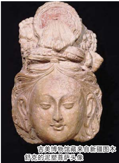
吉美博物馆藏来自新疆图木舒克的泥塑菩萨头像