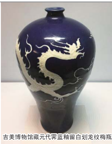
吉美博物馆藏元代霁蓝釉留白划龙纹梅瓶