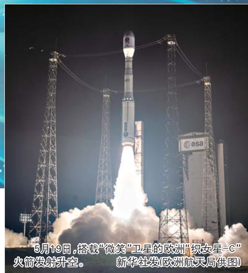
5月19日,搭载“微笑”卫星的欧洲“织女星-C”火箭发射升空。

“微笑”卫星任务是中国科学院(CAS)与欧洲空间局(ESA)首次开展任务级全方位深度合作的空间科学探测任务,也是中国科学院空间科学(二期)先导专项的收官之作。