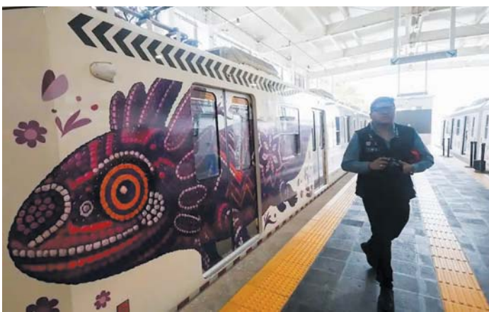
这是墨西哥城轻轨车厢上的钝口螈艺术图案。

世界杯即将开幕,主办地之一的墨西哥首都墨西哥城最近真的在“填坑”了。过去几个月,这座拉美超大城市的一些道路悄然变化:主干道上原本需要绕行的大坑正在快速减少。